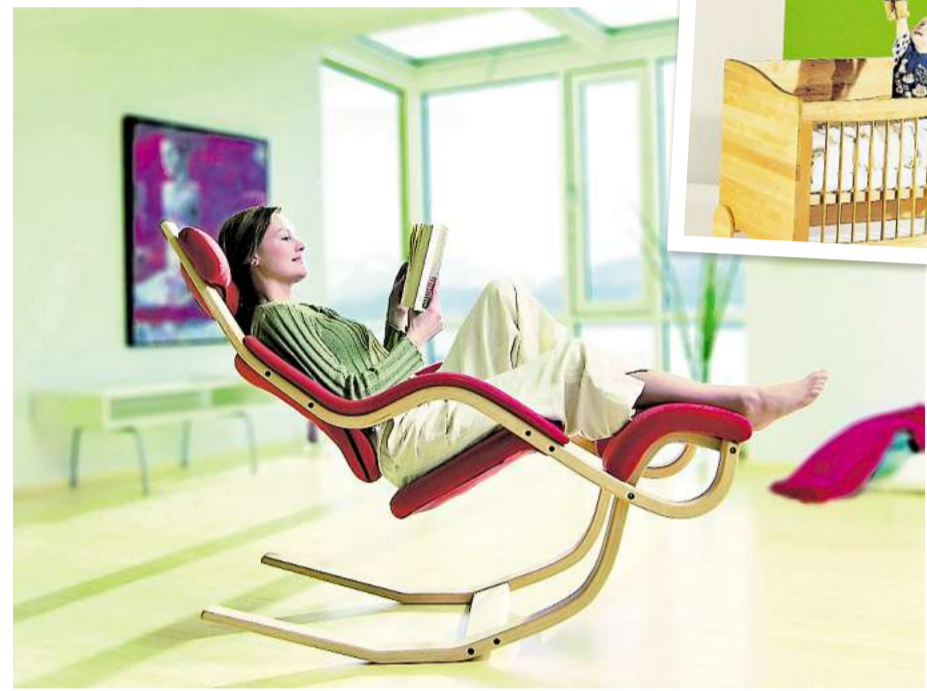
Ein behagliches und gesundes Zuhause – wer wünscht sich das nicht? Dafür sollten Baumaterialien und Möbel sorgfältig ausgewählt werden. Der Sessel Gravity besteht aus Eschenholz und das Kinderbett Triline aus gewachster Erle.